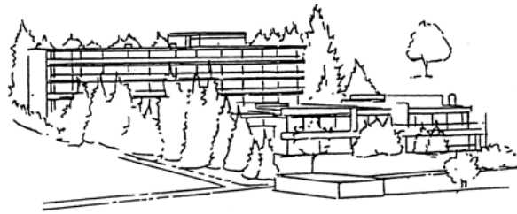
Hotel und Bildungszentrum Matt Gastfreundschaft seit 1761